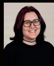
COLLEEN MATERNE Conception de décors