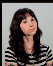
MÉLODIE SÉNÉCAL Conception sonore