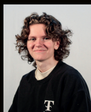
ANNABELLE DROLET Conception sonore