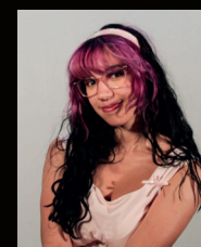
SARAH MINGORANCE Conception de décors